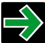
Tabelle: Fehlverhalten beim Rechtsabbiegen mit Grünpfeil.