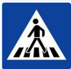
Tabelle: Fehlverhalten am Fußgängerüberweg.