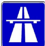
Tabelle: Die wichtigsten Tatbestände im Bezug auf Autobahnen und Kraftfahrtstraßen.