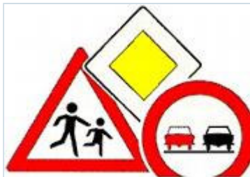
Collage von Verkehrszeichen

Auszug aus dem Bußgeld- und Punktekatalog (Stand: 01. Februar 2009)