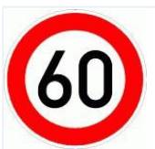
Tabelle: Allgemeine Tatbestände zum Thema Geschwindigkeit.