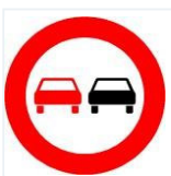
Tabelle: Rechtswidriges Überholen.